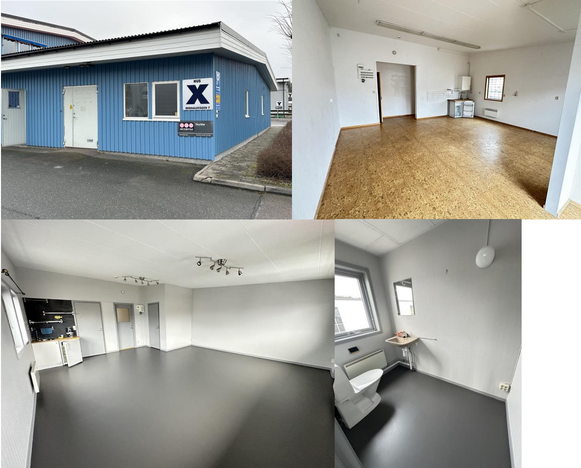
HUS X – UNDERVÅNING

Internet, larm och parkering ingår, el tillkommer.