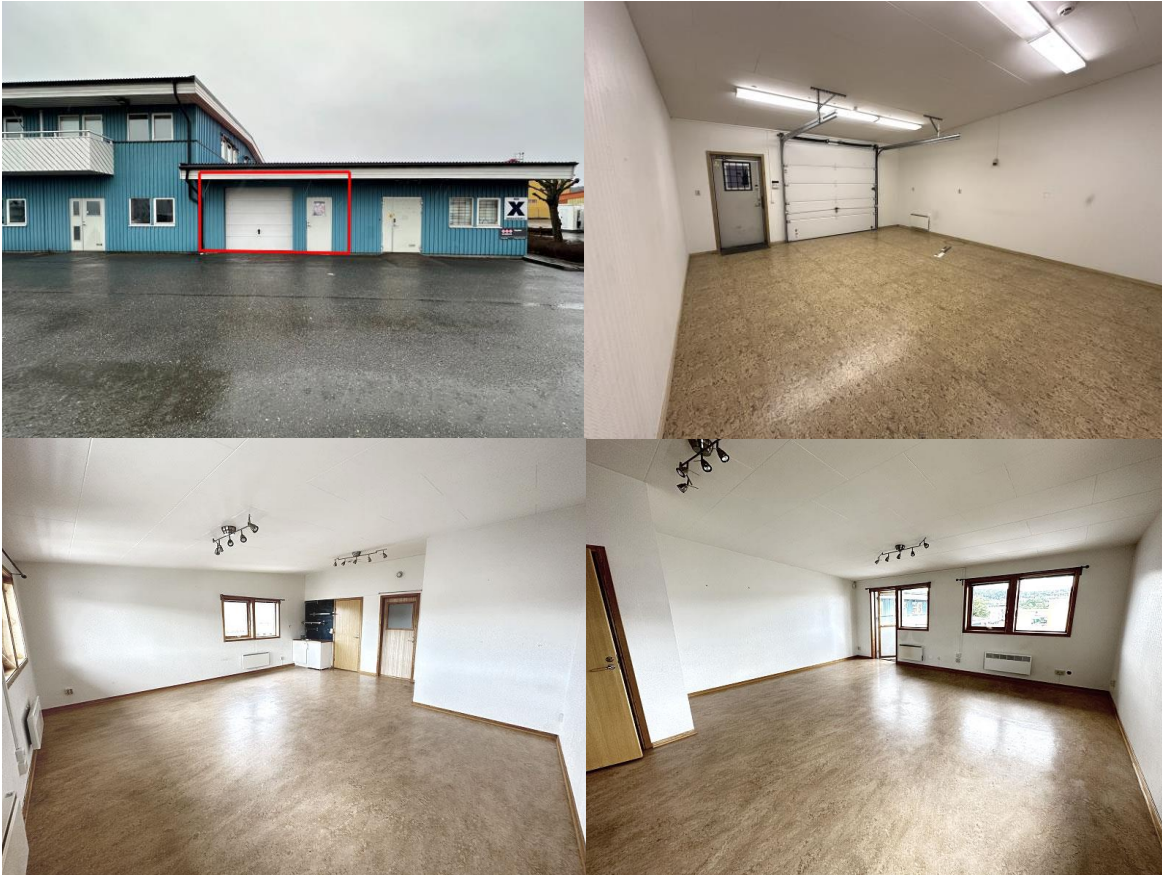
HUS X – UNDERVÅNING

Internet, larm och parkering ingår, el tillkommer.